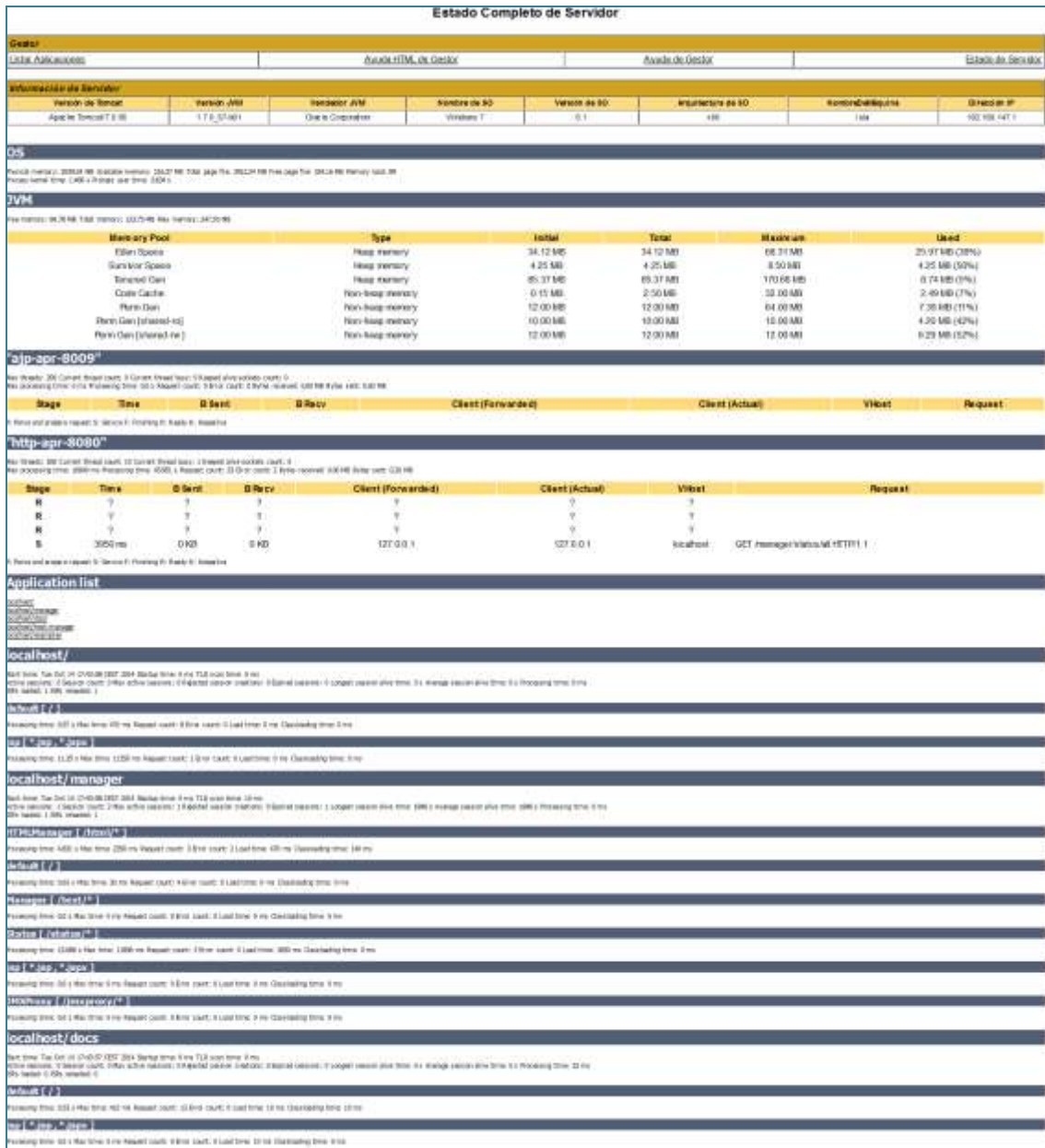
Figura 3.5.4: Estado del Servidor - Estadísticas